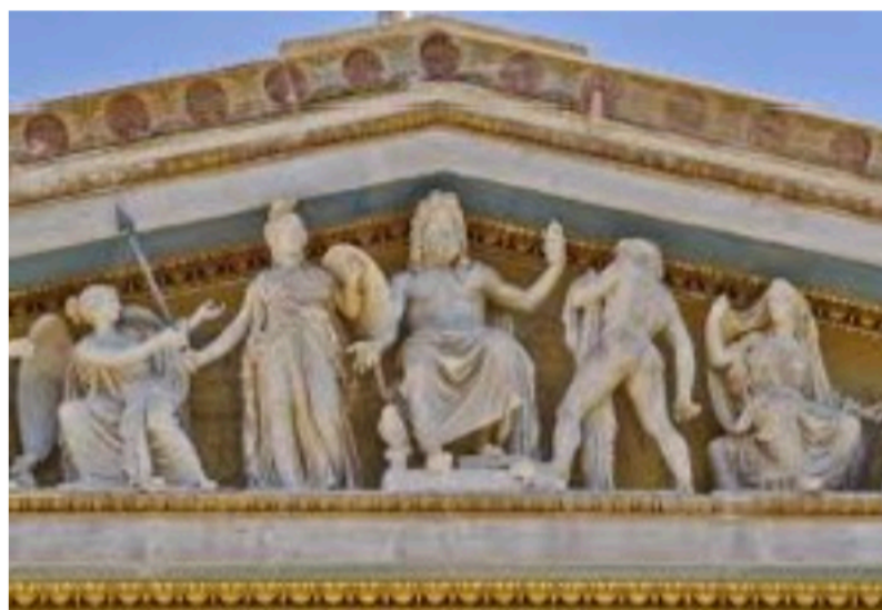
Los Dioses del Olimpo Sinapsis

Hoy les llamamos "los Dioses del Olimpo". Especialmente en vista del dramático crecimiento de exigencias para las familias productoras. En el trabajo de hormiga, invisible, de este equipo en las alturas legales y contables de la organización; radica la solidez de nuestro modelo Sinapsis. De forma que no hay mejor forma de reconocerles y honrarles que elevando a este equipo al frontón que se merecen. ¡Gracias!